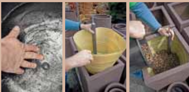
Nádoba připravená pro odtokový otvor