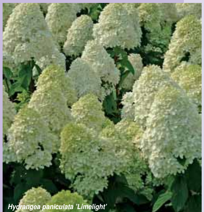
Hydrangea paniculata 'Limelight'