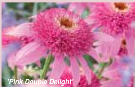
'Pink Double Delight'

Dnes ji ovšem najdeme právě tak na lékárenských pultech jako na trvalkových záhonech. Však také třapatkovka za poslední roky prošla nepřehlédnutelnou proměnou: z původního druhu byla vyšlechtěna řada odrůd různých výšek (od 60 do 110 cm)