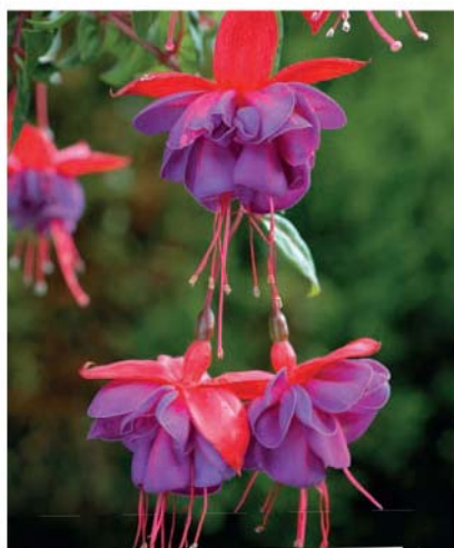
Čílko ( Fuchsia )