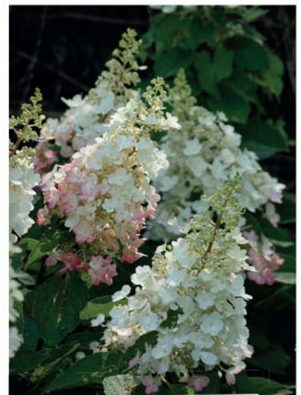
Hortenzie latnatá ( Hydrangea paniculata )