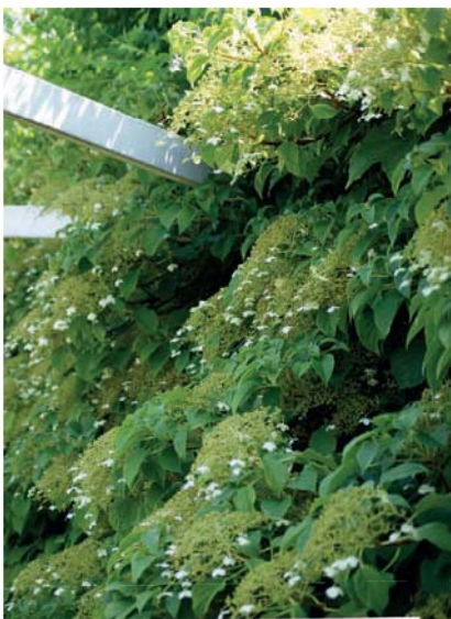
Hortenzie řapíkatá ( Hydrangea petiolaris )