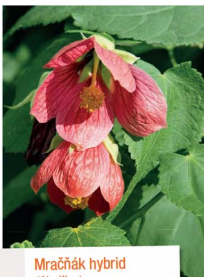
Mračňák hybrid ( Abutilon )