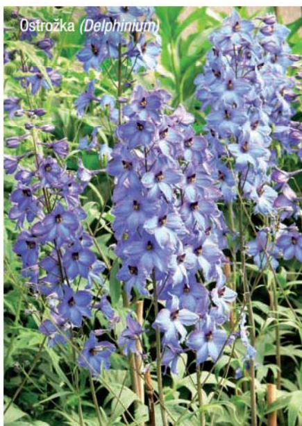
Ostrožka ( Delphinium )