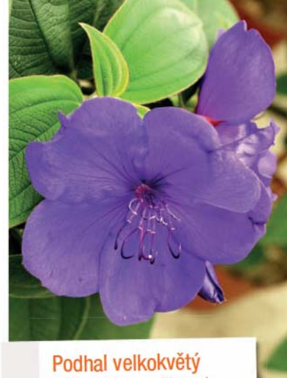
Podhal velkokvětý ( Tibouchina urvilleana )