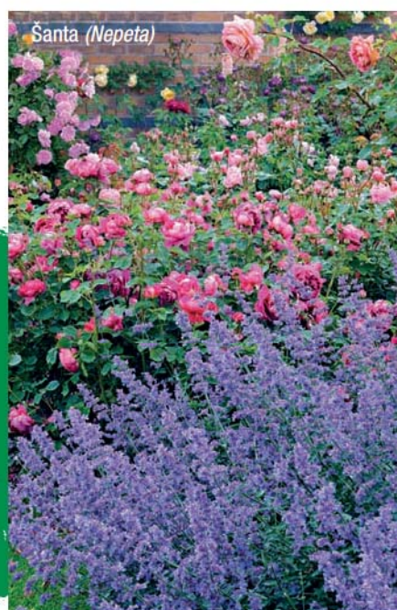
Santa ( Nepeta )

Největší předností tohoto minerálního hnojiva je způsob a frekvence použití: aplikuje se totiž jen na začátku sezóny ručním rozhozem a působí až šest měsíců.