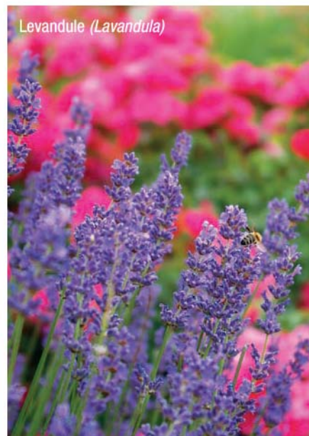
Levandule ( Lavandula )