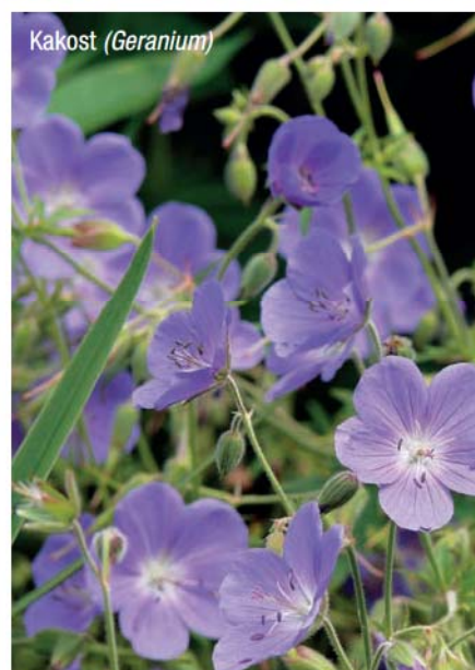
Kakost ( Geranium )