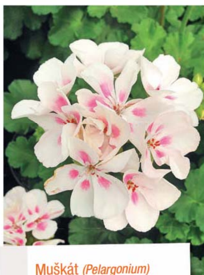
Muškát ( Pelargonium )

Pokud bychom si vypůjčili symboly pro označování velikosti oblečení do našich zahradnických center, mohli bychom se chlubit, že nabízíme nejen vzrostlé stromy o velikosti XXL, ale na opačné straně spektra i rostliny téměř trpasličího vzrůstu. K nim bychom mohli přiřadit i nádobové rostliny zapěstované na kmínku. Jejich přirozený habitus je keřový, ale při troše šikovnosti a dostatku trpělivosti se mohou tvářit i jako stromky, které se výborně hodí na letní terasu.