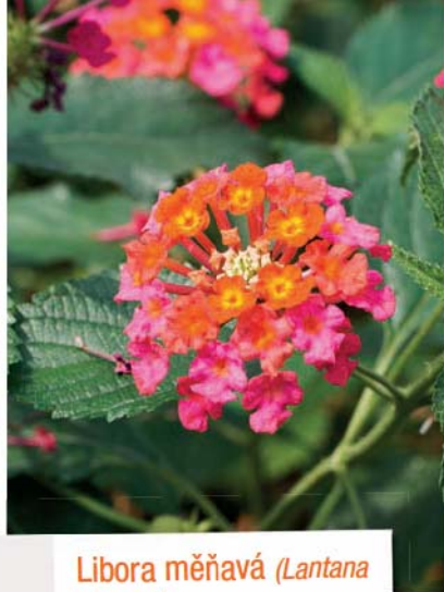
Libora měňavá ( Lantana camara )