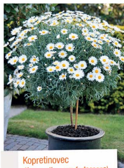
Kopretinovec ( Argyranthemum frutascens )