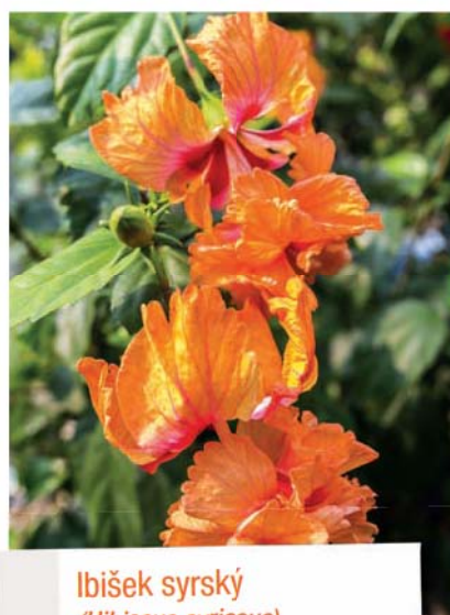
Ibišek syrský ( Hibiscus syriacus )