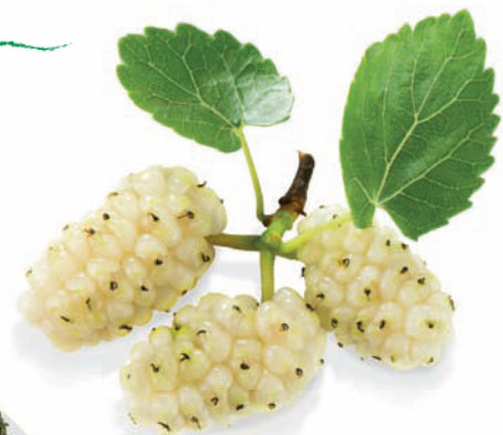
Moruše bílá ( Morus alba )