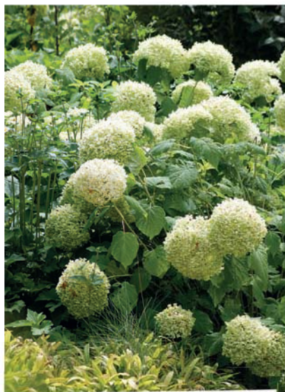
Hortenzie stromečkovitá ( Hydrangea arborescens )