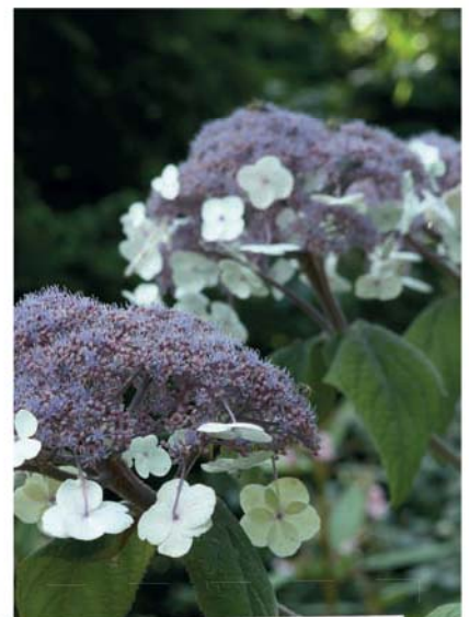
Hortenzie drsná ( Hydrangea aspera )