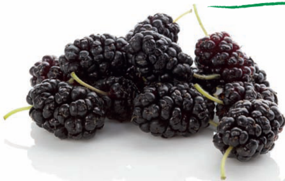
Moruše černá ( Morus nigra )