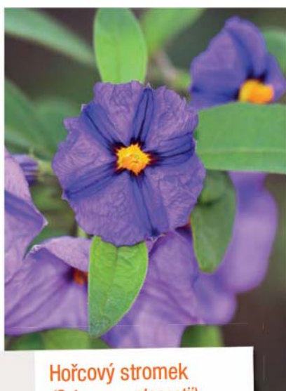
Hořcový stromek ( Solanum rantonnetii )