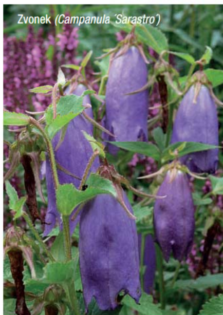
Zvonek ( Campanula 'Sarastro' )