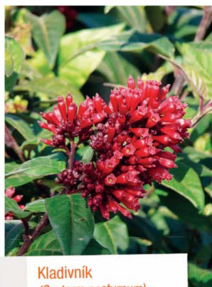
Kladivník ( Cestrum nocturnum )