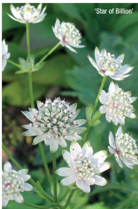
'Star of Billion'