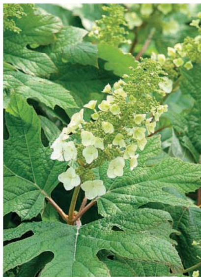
Hortenzie dubolistá ( Hydrangea quercifolia )