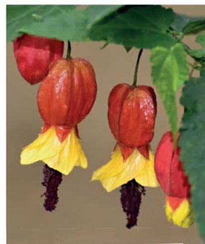
Mračňák poříční ( Abutilon megapotamicum )