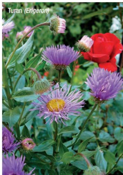
Turan ( Erigeron )