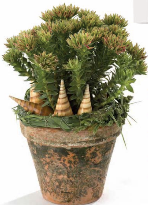
Crassula coccinea Rubin stylet