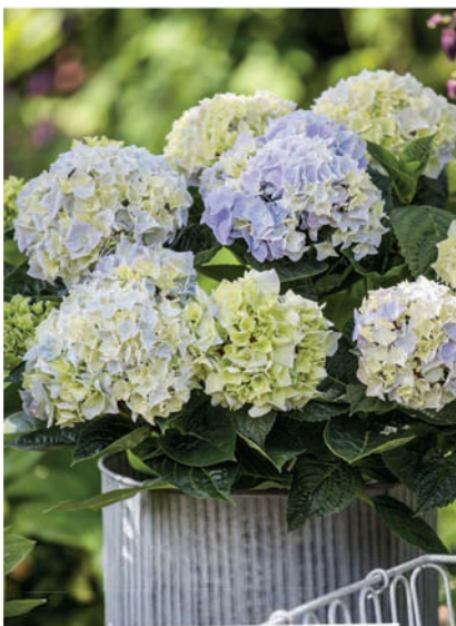
Hortenzie velkolistá ( Hydrangea macrophylla )